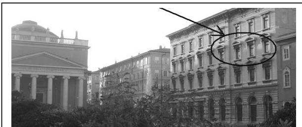
Esterno della sede dell'Accademia Cranio-Sacrale